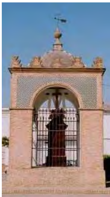
La Cruz del humilladero en la Plaza de España (Plaza Pinichi)