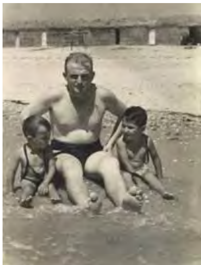
En la orilla y las chozas de fondo.