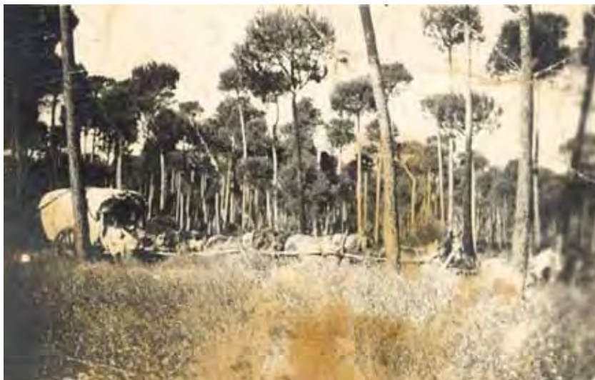
El carro de Rubiales atravesando el Coto de Doñana.