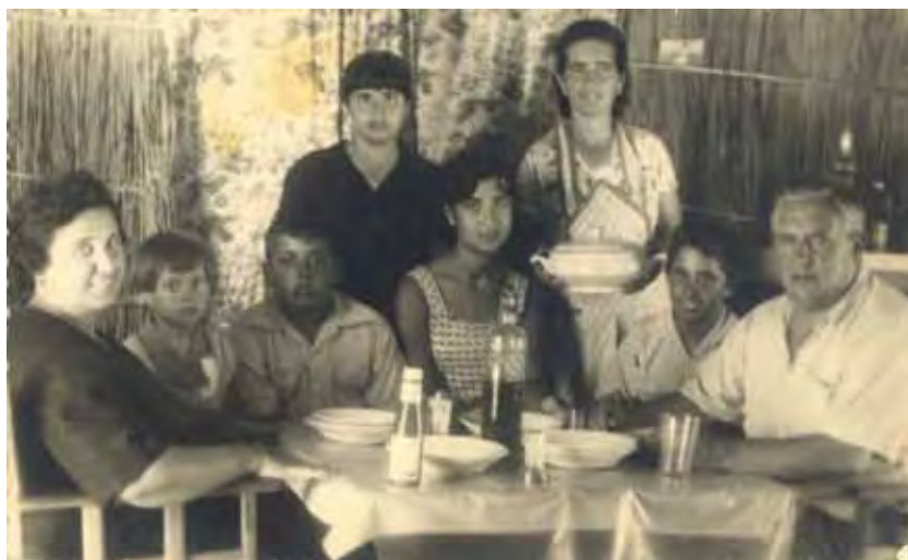
Vida en la choza. La familia se reúne para el almuerzo.