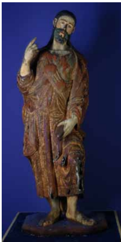
Fig. 2: Vista frontal de la Imagen antes de comenzar la intervención. Fotografía con ultravioletas. Eugenio Fernández Ruiz. IAPH.

Es en este pequeño edificio es donde se fundará la Hermandad del apóstol Santiago y posteriormente otra fundación bajo la advocación de la Hermandad del la Vera Cruz. A finales del siglo XVI La hermandad de la Vera-Cruz se fusionará con la del apóstol Santiago. 2