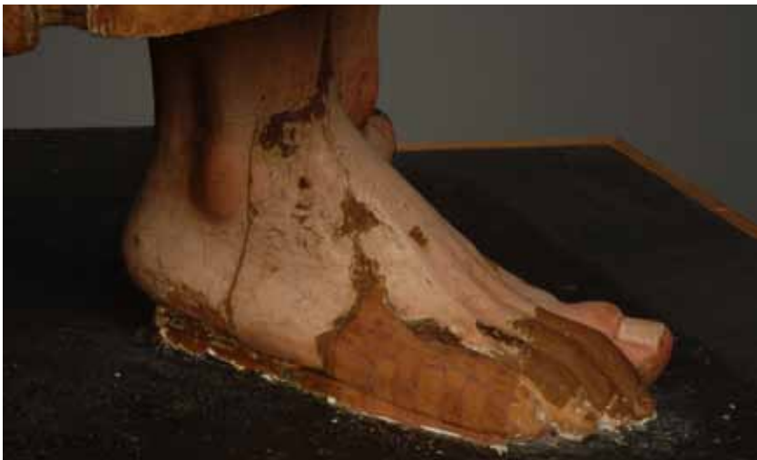
Fig. 13: Detalles del proceso de consolidación del soporte. Pie derecho de la imagen.