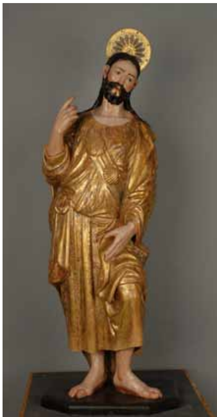
Fig. 9: Frontal de la Imagen, una vez concluida la intervención.

esclavina, bordón con calabaza, sombrero de ala ancha, zurrón y concha- que se difundirá ampliamente en la España del siglo XVII, sin que esto implique, en absoluto, la desaparición del tipo de “apóstol-peregrino” que seguirá ocupando un lugar destacado en el repertorio iconográfico jacobeo.