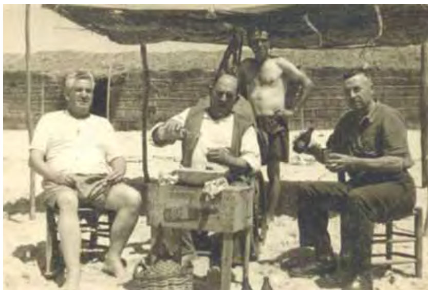
Momento de ocio en el sombrero frente a la choza.