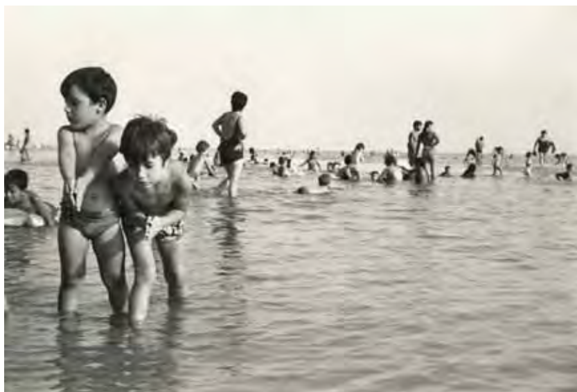
El baño como principal momento del día.