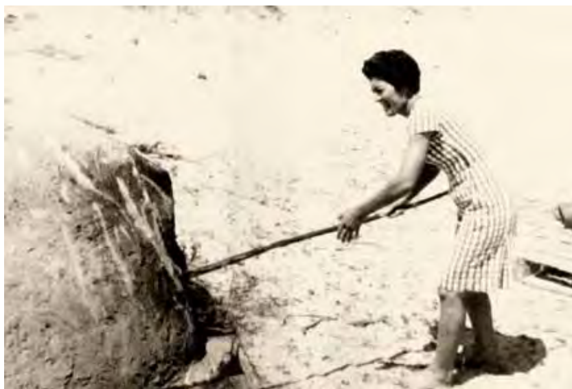
El horno de pan.