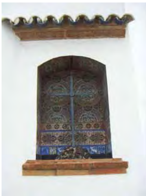
Cruz de la Ermita de Ntra. Señora de Belén.