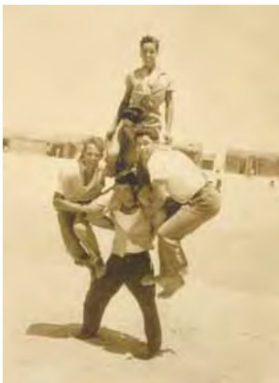
El deporte como elemento complementario del ocio.