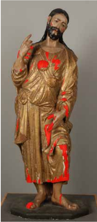
Fig. 11: Técnicas infograficas aplicadas a la intervención de la Imagen de Santiago. Enrique Gutiérrez Carrasquilla. IAPH.

La preparación, presentaba falta de adhesión al soporte en numerosas zonas, Incluidas las lagunas estucadas en la última intervención. Su estado era regular y conservaba aproximadamente un 75 %. (Fig.11).