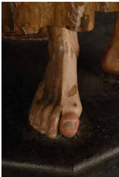
Fig. 15: Proceso de limpieza en el pie derecho de la imagen. Eugenio Fernández Ruiz. IAPH.

tenía regular adherencia y de que ocultaba parcialmente la capa policroma original, se considero por criterio visual y diferenciativo eliminarlo.