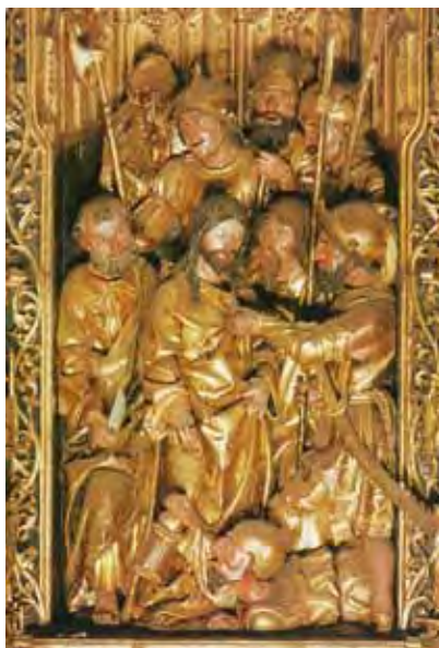
Fig. 19: Prendimiento del retablo mayor de la Catedral de Sevilla, Jorge Fernández y taller. Primer tercio del siglo XVI. Del libro "El retablo Mayor de la catedral de Sevilla".