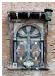
Fachada del palacio del Marqués de Tarifa (Casa Pilatos ). Sevilla.