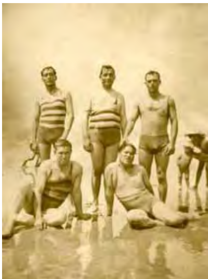
Bañistas en los años treinta.