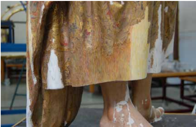
Fig. 17: Detalles del proceso de reintegración cromática. Eugenio Fernández Ruíz. IAPH.