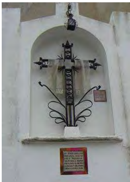
Cruz de la calle Pineda o de Luisa Quintero.

me comenta de nuevo Manolo palerena , recibía su nombre precisamente por encontrarse allí un singular monte Calvario con tres cruces. Lo mismo ocurre con la calle Cruz, paralela a la calle Luis de Medina, en cuya esquina aún se aprecia el recuerdo de la que en tiempos conservaba hecha de madera.