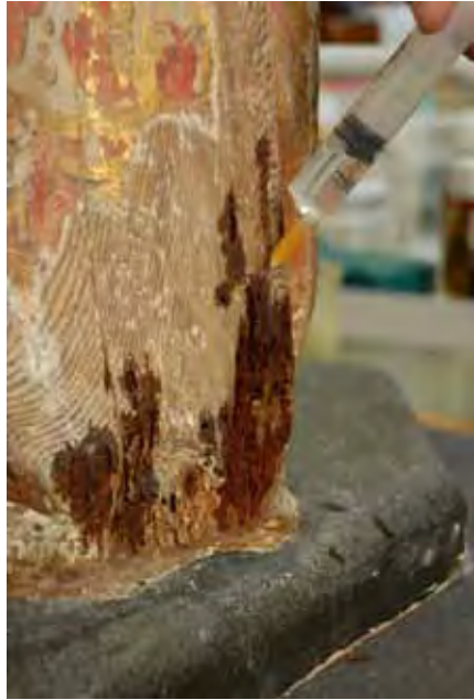
Fig. 12: Detalles del proceso de consolidación del soporte. Zona atacada por xilófagos. Eugenio Fernández Ruiz. IAPH.

Se ha eliminado el dorado realizado en la última intervención, pues aparte de que