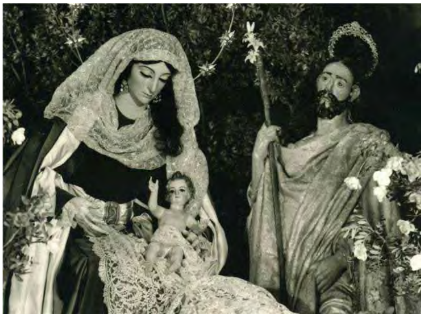
Fig. 4: Belén montado en la ermita. Pilas (década de los setenta del siglo pasado).