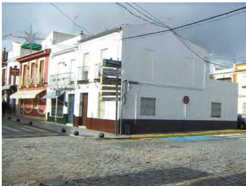
La esquina de la calle Luis Medina (calle Sevilla ) con San Pío X, primitiva ubicación de la Cruz del humilladero.

De ahí la trascendencia del documento que hemos encontrado en el archivo histórico de protocolos de Sanlúcar la Mayor, gracias al cual podemos tener la certeza de que estas mismas costumbres ya se remontaban al menos cuatrocientos años atrás, reconociendo en sus palabras el mismo debate sobre la importancia que siempre tuvo para los pileños el emplazamiento de la Cruz del humilladero. Además, nos permite acercarnos al origen de algunas manifestaciones religiosas, de los cultos y procesiones de Semana Santa que se hacían a principios del siglo XVII, a partir de ciertos indicios que, aún reconociendo su vaguedad, no por ello resultan menos interesantes dada la escasez de noticias sobre las hermandades locales para aquellas fechas.