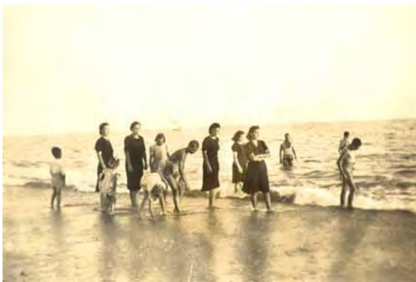
Paseo por la orilla, el baño y cogiendo coquinas.