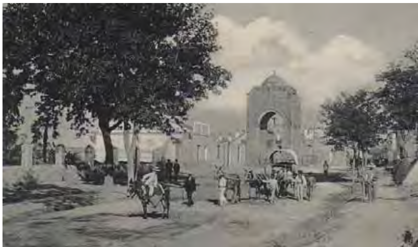
Fotografía de la Cruz del campo (Sevilla), principios del siglo XX.

Pilas se le daba a dicha Cruz. Primero, allí se celebran “las festividades que se hacen cada año de la Santísima Cruz” o, como dice Francisco Pérez, “las fiestas que hace el lugar, como son las de la Santa Cruz de Mayo y otras”. Son los días que la iglesia dedica a la Invención de la Cruz (3 de Mayo) -día escogido también por la Hermandad de la Vera-Cruz para celebrar su cabildo de elecciones 24 - y a la Exaltación de la Cruz (13 de Septiembre). Segundo, el mismo Francisco Pérez nos dice “que todos los vecinos de este lugar en los Viernes de Cuaresma van a hacer oración allí”. Probablemente se esté refiriendo a la realización de un cierto Vía-crucis, como es propio de esos días dentro del calendario litúrgico. Y, tercero, la Cruz del humilladero es el lugar –cito las palabras del alcalde- “a quien las procesiones de la iglesia de esta villa van siempre a hacer oración [...] sirviendo de rodeo a las dichas procesiones y en particular en las procesiones de sangre que se hacen el Jueves y Viernes Santo”. Pedro Avilés declara que “todas las procesiones que este lugar hace cada año y las de la Semana Santa de sangre siempre van a rezar allí y hacer oración”. Por