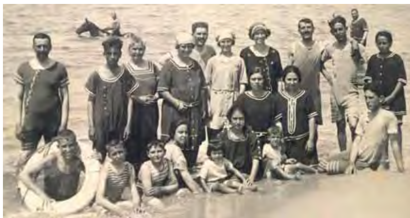
Bañistas en los años veinte.