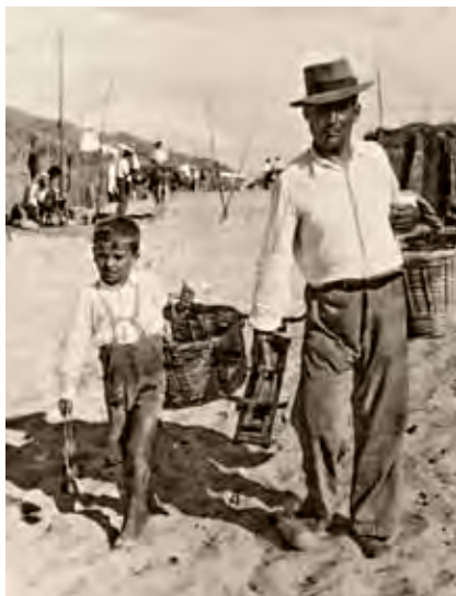
Padre e hijo en la venta de verduras y frutas.