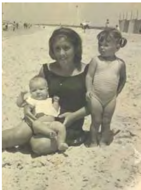
Posando en la orilla y al fondo, a la derecha, el cine como elemento de ocio.