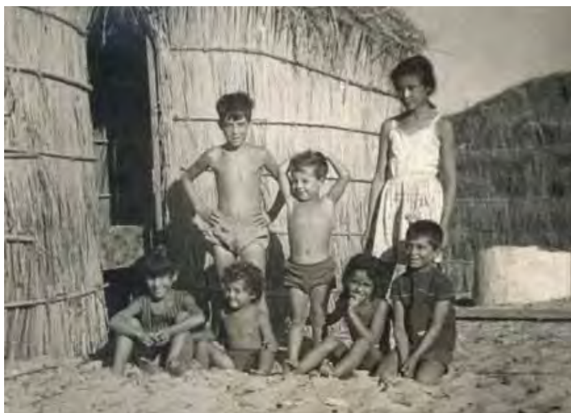
Niños en la puerta de la choza.