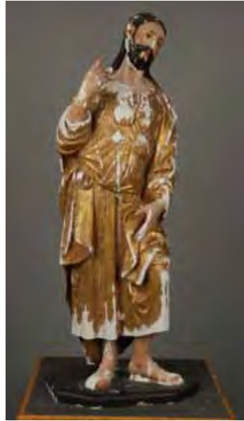
Fig. 16: Vista frontal de la Imagen de Santiago, en proceso de estucado.

Las obras de arte están expuestas a múltiples intervenciones, máxime si se trata de obras de arte con carácter devocional. En el caso que nos ocupa las intervenciones, con los cambios que ha conllevado, configuran las características técnicas y estéticas de la obra, que es lo que hace que una obra de arte sea única. Con esta perspectiva el tratamiento realizado ha intentado en todo momento respetar y conservar estos aspectos.