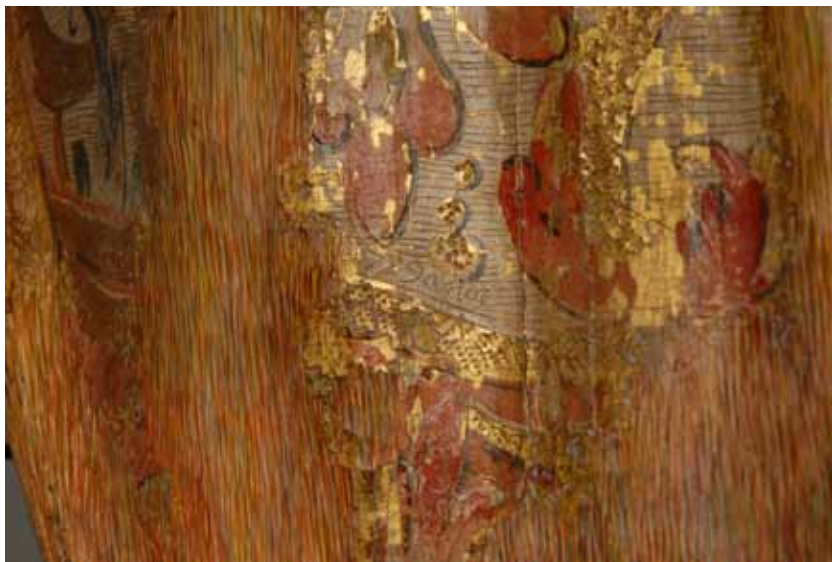
Fig. 3: Detalle de la inscripción en el manto. Eugenio Fernández Ruiz. IAPH.

En los años ochenta -por fuentes verbales- se sabe que hubo una intervención integral: se cambia la peana, se reintegran volumetricamente algunas piezas y se dora algunas lagunas a cargo del taller de la restauradora Blanca Guillén.