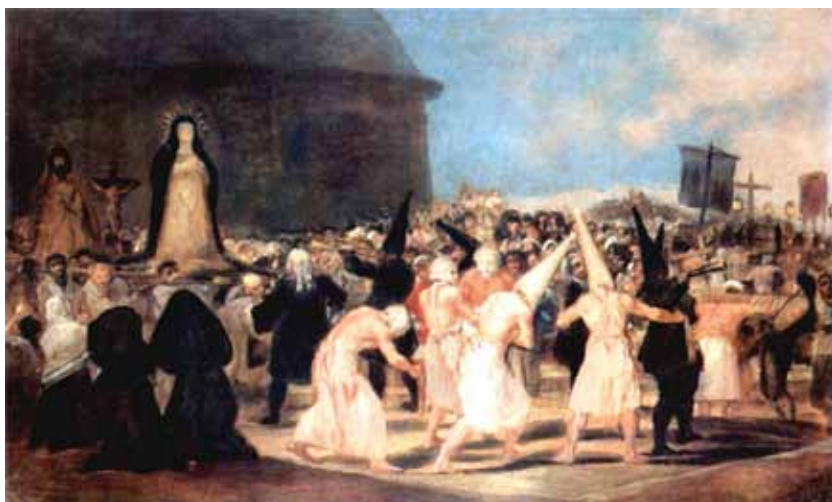
Procesión de disciplinantes (Francisco de Goya), siglo XIX. Museo del Prado.

Como afirma este mismo autor, las imágenes sobre andas o parihuelas -los misterios - surgen con posterioridad a la del Crucifijo o Cruz alzada, pero no en el siglo XVII. Existen noticias fehacientes de pasos para el último tercio de la centuria anterior, al igual que la presencia de costaleros, si bien las pequeñas proporciones de estas primitivas andas y el poco peso de las imágenes -normalmente realizadas en pasta, como nuestro Cristo viejo de la Vera-Cruz que se conserva en la sacristía de la Ermita- no precisaba de muchos hombres para portarlas 39 . Es el momento en que se incorporan las imágenes de un Cristo crucificado y de una Virgen dolorosa, que pronto cobraría protagonismo por su llamativo ornato y la incorporación del palio (el primer testimonio se encuentra en un dibujo del Libro de Reglas de la Hermandad de la O fechado en 1566 40 ).