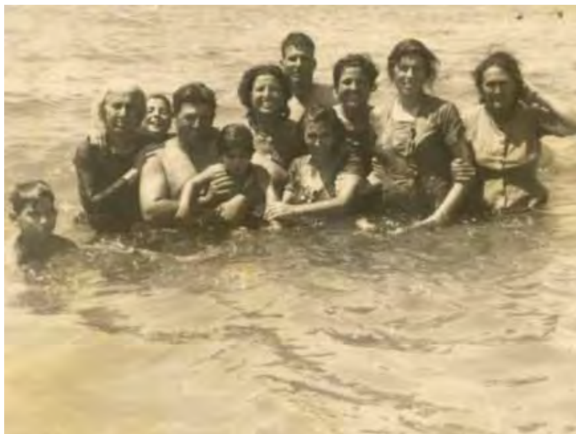
Fotografía obligada para todas las familias: posando en el mar.