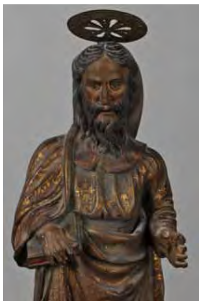
Fig. 7: Santiago del retablo de Santa Ana de Triana (Sevilla), Pedro Delgado o Nufro Sánchez. Primer tercio del siglo XVI. José Manuel Santos Madrid. IAPH.

muerte del Apóstol, así como de su traslado a Galicia, podemos encontrarlos ya en obras de fines del siglo XII y principios del XIII, entre las que cabe citar, como ejemplo, un capitel del claustro de la catedral de Tudela y un pequeño grupo de capiteles de la seu Vella de Lerida.