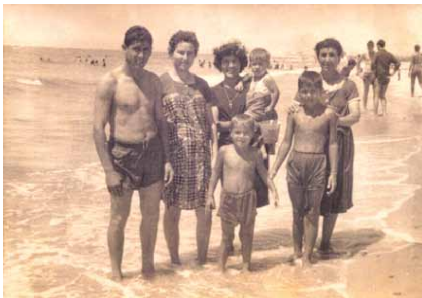
Familia posando en la orilla. En el centro, el autor de esta conferencia.