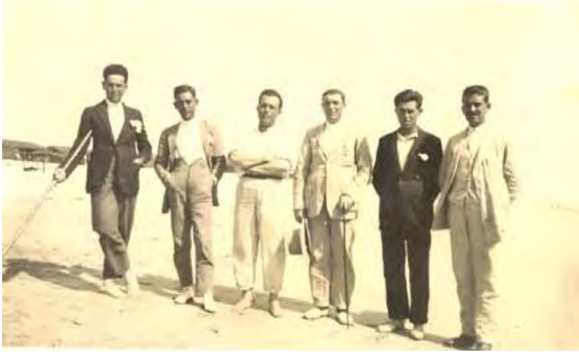
Pileños paseado por la playa. Imagen plasmada en postal cuyo texto se transcribe.