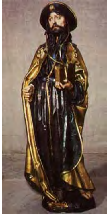
Fig. 8: Santiago del retablo mayor de la Catedral de Sevilla, Jorge Fernández y taller. Primer tercio del siglo XVI. Del libro “El retablo Mayor de la catedral de Sevilla”.

Como peregrino puede ir calzado o descalzo, con túnica y manto, que a veces es un capote de fuerte estameña parda como los que llevaban los peregrinos en la Edad Media, y no muy largo para permitirles andar con facilidad. Lleva bordón que se remata en su parte superior por una especie de pomo, y que acaba en punta en la parte baja; sombrero, calabaza, escarcela o sportilla y concha. Buena muestra de esta interpretación sería la Imagen que realizó Felipe Vignary para el retablo de San Andrés en la capilla del Condestable de la catedral de Burgos a principios del XVI. (Fig.6). Otra bonita muestra es la que se realiza para la el retablo de Santa Ana de Triana en Sevilla, realizado por Pedro Delgado o Nufro Sánchez. (Fig.7). Algo anterior es la que realiza Jorge Fernández y taller para el retablo mayor de la Catedral Hispalense. (Fig.8). A veces se le ve