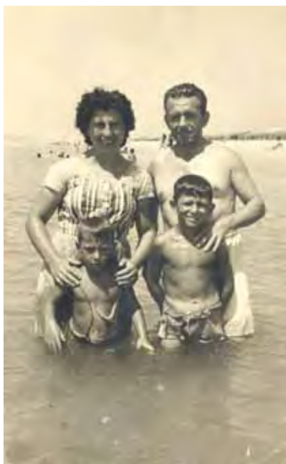
La familia unida por Matalascañas.