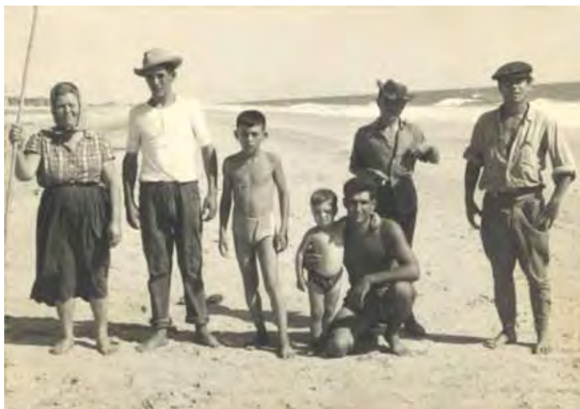
Grupo de choceros en la playa.