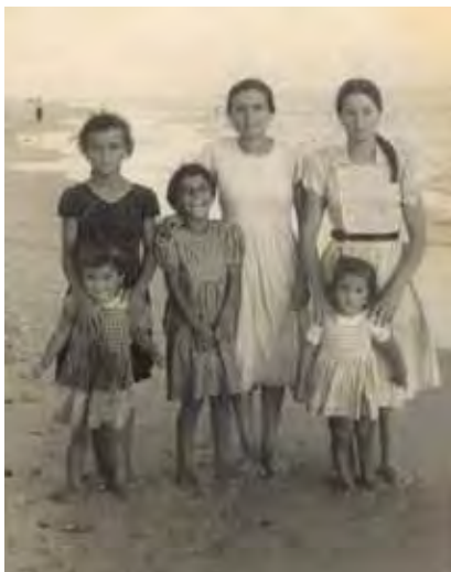
Grupo paseando por la orilla.