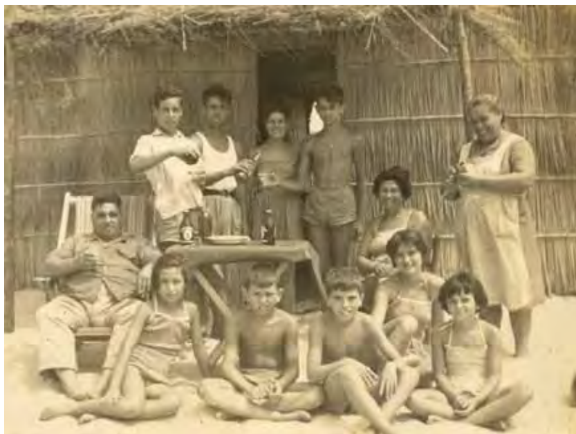
Celebración en torno a la mesa en la puerta de la choza.