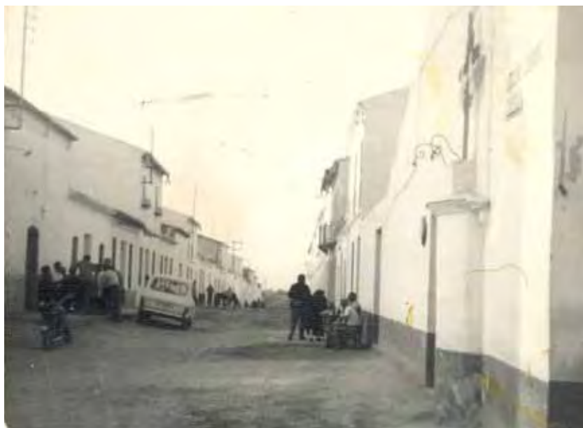
Calle Blanca Medina, a la derecha la Cruz de la Plaza del Pilar.

y la moda de vestir a la Virgen alegremente con trajes de brocado de color y corona imperial, cuando lo usado hasta entonces era la austeridad del luto con trajes de lana, pues “no van allí con pompa de alegría, sino con manifestación de sentimiento y compasión” 41 . Según Esther Fernández de Paz, “el pueblo de volcó en la adición de elementos realistas (ojos, vestiduras, joyas, etc.), buscando alejarse de la fría estatuaria y lograr la mayor semejanza posible con las figuras humanas (...)” 42 . De esta manera, el exceso teatral a que llegaron las procesiones penitenciales durante el siglo XVII se plasmaría incluso en el deseo de hacer actuar a las propias imágenes, bien mediante la articulación de sus extremidades para impartir bendi-