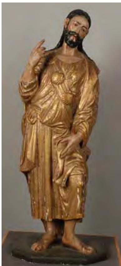
Fig. 1: Vista frontal de la Imagen de Santiago antes de comenzar la intervención.