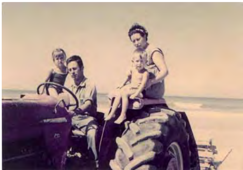
El tractor de Chiribi que recogía pasajeros y bultos.