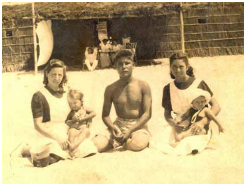
Posando frente a la choza.