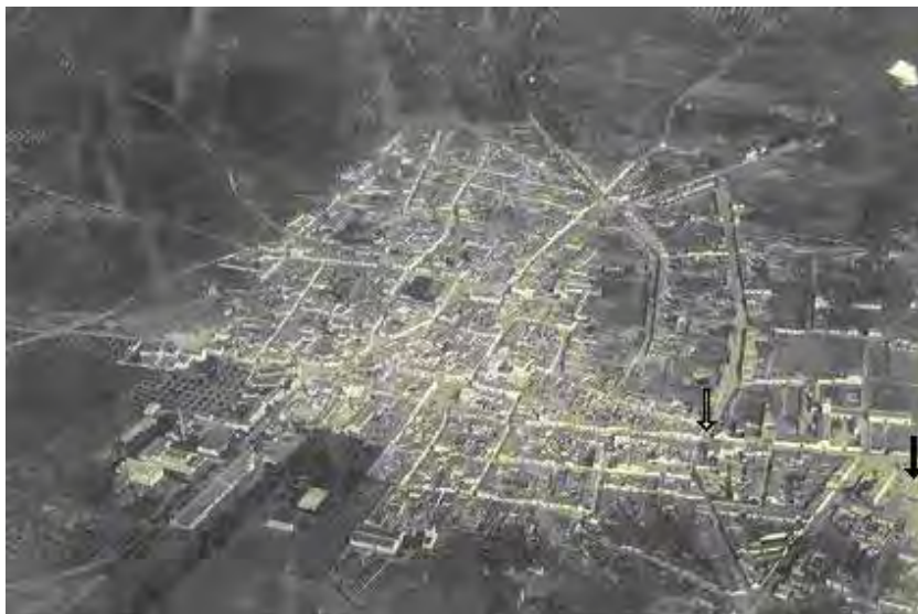
Vista aérea de Pilas (1928). Fue en este año cuando se realizó el traslado de la Cruz del humilladero a su nuevo emplazamiento.

pueblo. Si tales rumores llegaran a confirmarse creemos justas las protestas de estos vecinos, los cuales estiman más oportuno el que un pueblo conserve sus tradiciones y lugares típicos aunque esto no esté conforme con la mayor visualidad de sus calles”. 7