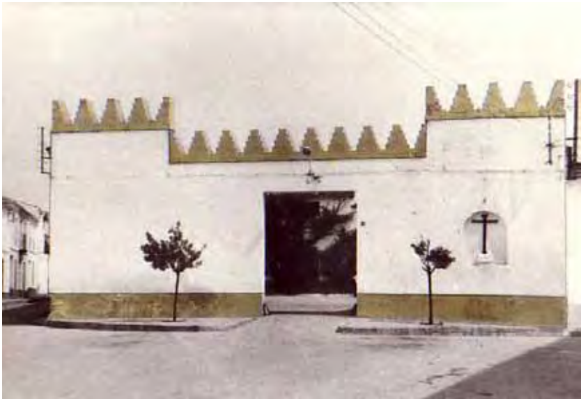
Cruz de La Portá . Casa señorial de la Familia Medina, ubicada en la Plaza del Cabildo, ya desaparecida.