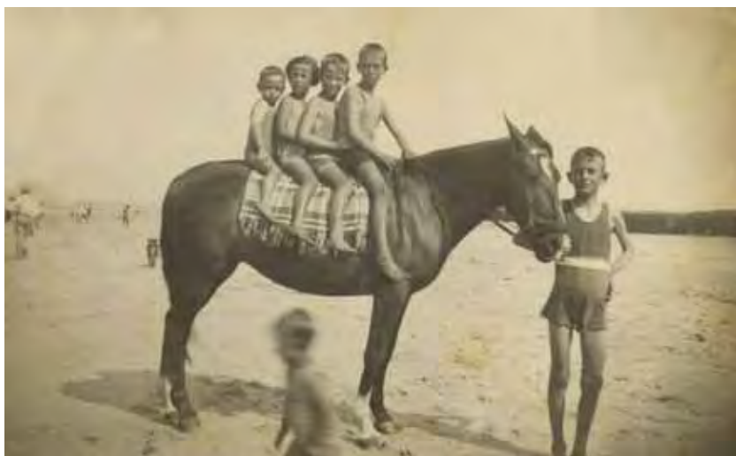
Los animales, aparte del ocio, jugaron un papel importante en la vida de Matalascañas.