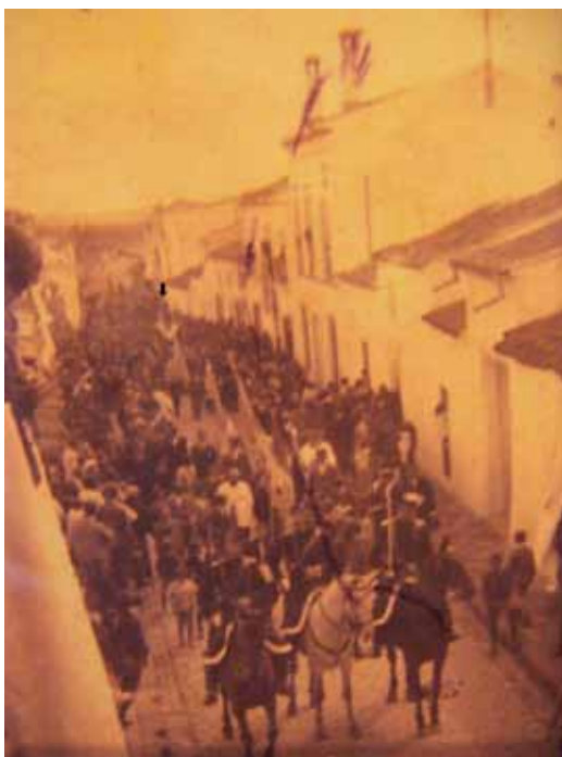
Procesión del Corpus por la calle Luis Medina (1923). Al fondo se observa la Cruz del humilladero formando parte del cortejo.

El día 27 de Mayo de 1927 hubo de celebrarse otra sesión extraordinaria donde se acordó la transferencia de crédito “para dar cumplimiento al acuerdo de este Ayuntamiento pleno de fecha de 23 de Febrero último, sobre el ensanche de la calle Luis Medina y construcción de la nueva capilla para la Santa Cruz del humilladero, toda vez que para realizar el ensanche es imprescindible demoler