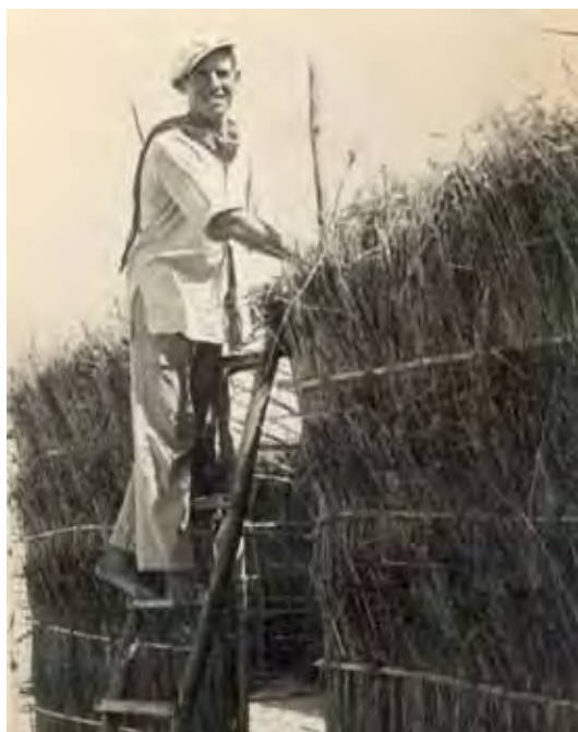
Dos momentos de la construcción de las chozas.