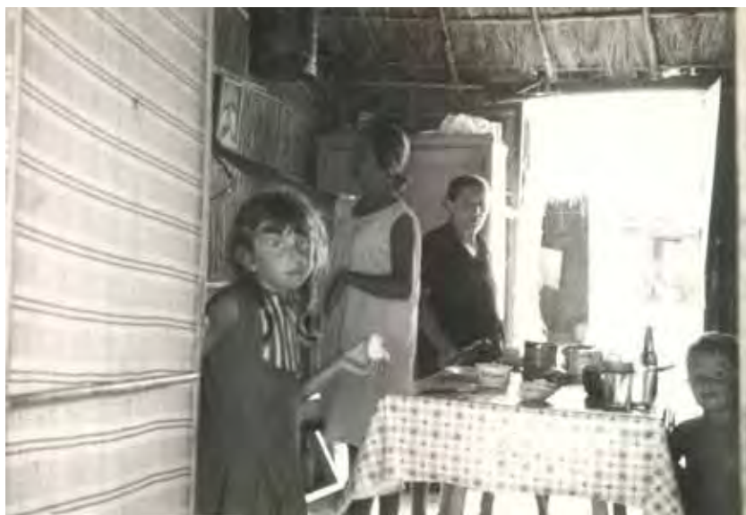
Interior de la choza. Momento del desayuno.