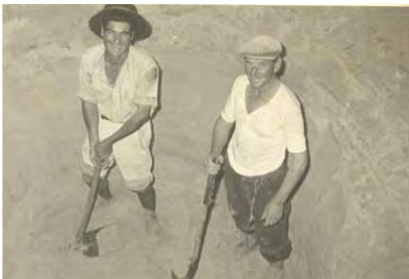
El agua potable se sacaba de pozos artesanales que se hacían junto a las chozas. En la fotografía, un momento de su construcción.