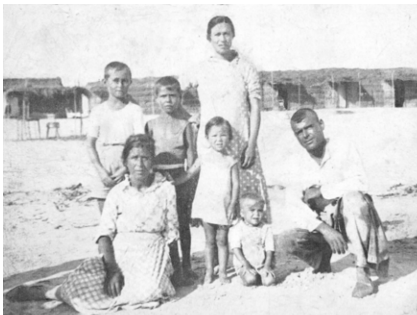
La familia, al completo, posa con las chozas al fondo.