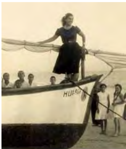
Foto en la barca.