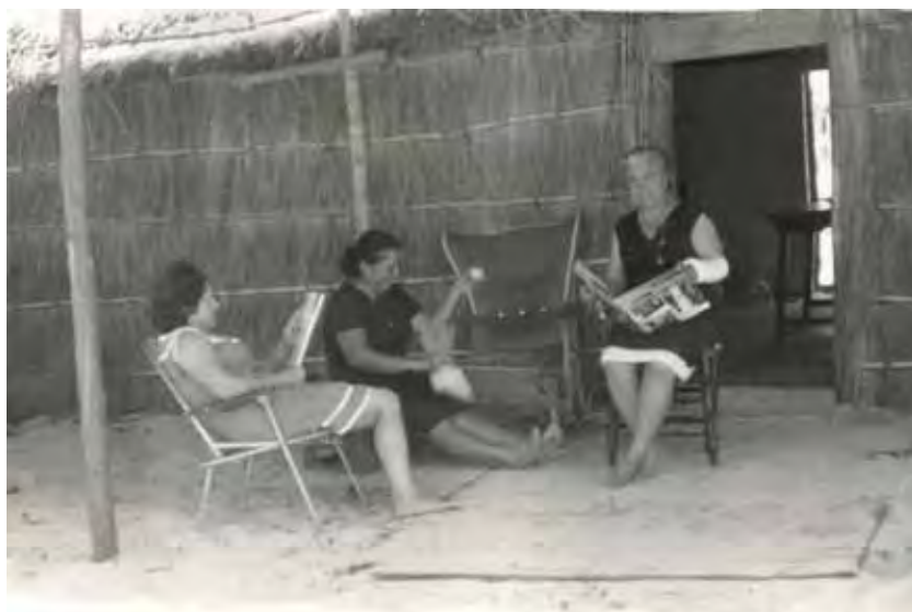
Tertulia vespertina en la puerta de la choza.