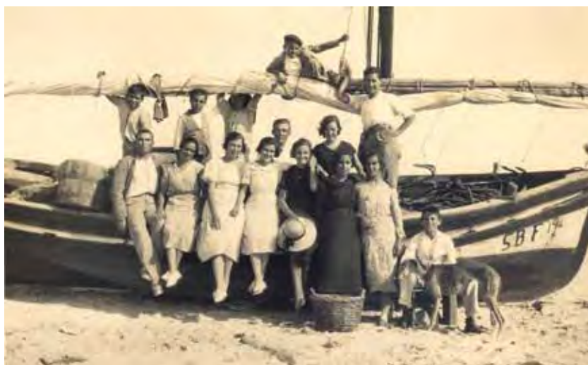
Posando toda la familia en la barca.