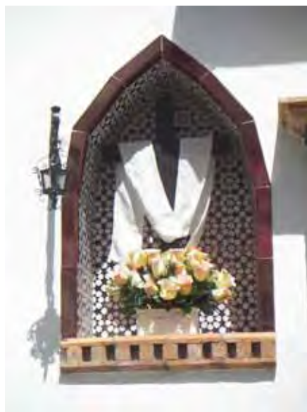
Cruz de la calle Obispo Jesús Domínguez (calle Nueva).

largo de los siglos, me atrevo a sugerir que el itinerario de las primeras procesiones de Semana Santa en Pilas era de tipo circular, similar al que se hace actualmente, pasando por los tres puntos más destacados de la devoción local: la ermita conocida bajo la advocación del Apóstol Santiago y sede de la hermandad de la Vera-Cruz, que alberga la venerada imagen de la Virgen de Belén (imagen anónima que puede datarse por estas mismas fechas), la Cruz del humilladero en la calle Sevilla y la iglesia parroquial de Santa María, que así se conocía antiguamente. Dicho itinerario estaría compuesto de cierto