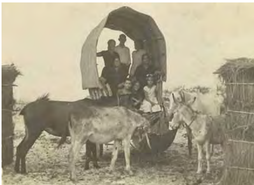
Momento de la llegada a la Playa de Matalascañas.