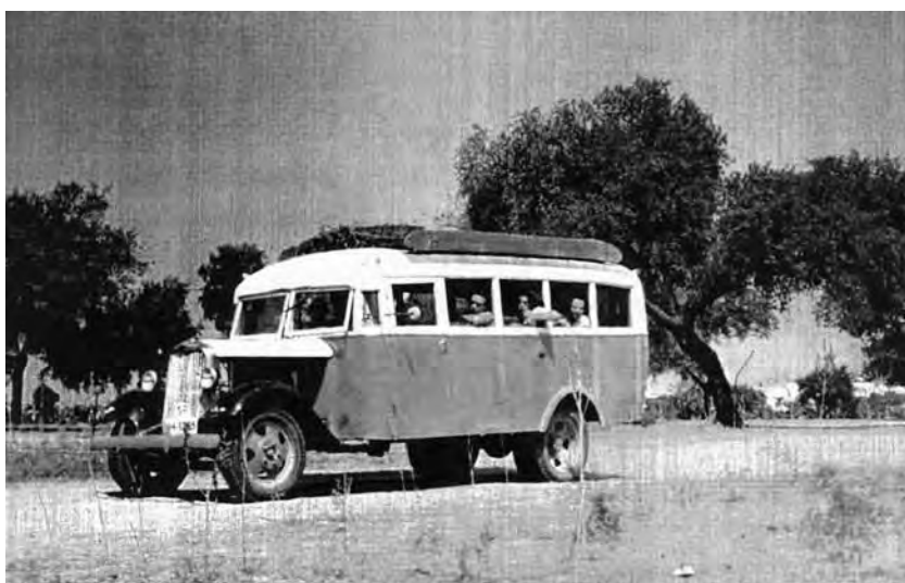
El autobús del Rada se dirige a cruzar la Marisma.