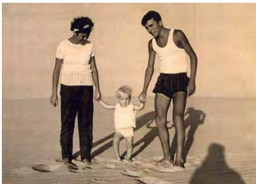
Foto para el recuerdo en las dunas de Doñana.