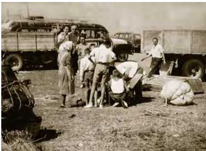
La Pará. Momento para cambiar de transporte para cruzar los cerros de dunas.