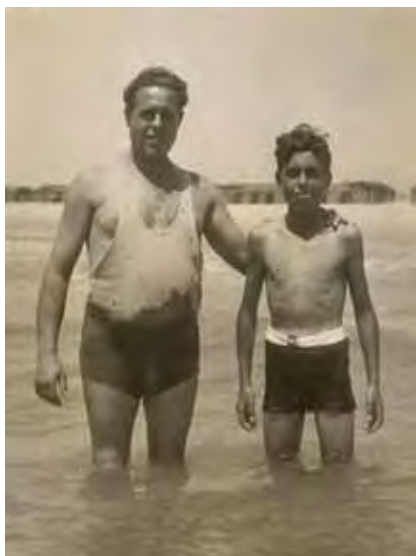
Bañistas en los años cuarenta.