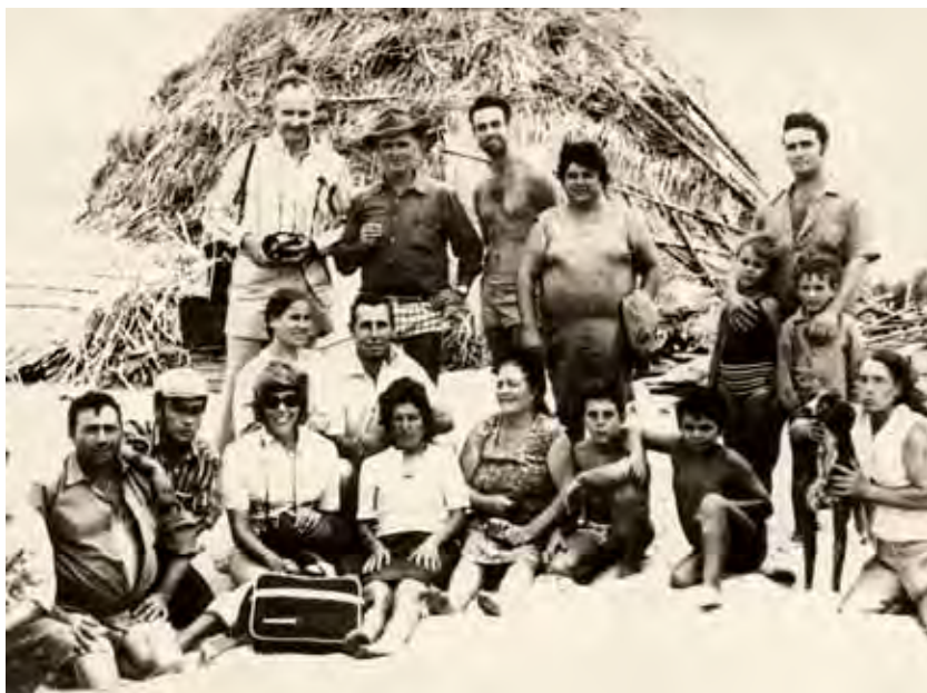
Grupo de choceros con turistas. Al fondo el almiar.