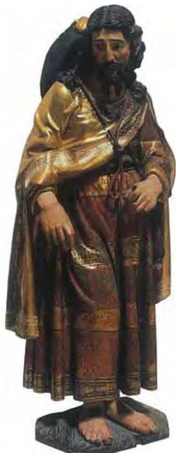
Fig. 6: Santiago del retablo de San Pedro en la capilla del Condestable. Catedral de Burgos, por Felipe Vigarny. Primer tercio del siglo XVI.