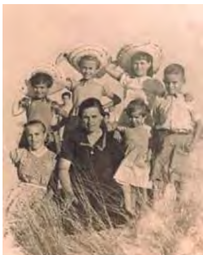
La familia posando en los cerros de Matalascañas.

Con respecto a los carabineros, que así se llamaban los guardias civiles alejados de sus familias de procedencia, se pasaban el año añorando que llegase la época estival para tener compañía de la gente de nuestro pueblo, hasta tal punto que algunos llegaron a formar familias con vecinos nuestros. Fueron tantas y tan buenas las relaciones que las mismas están llenas de anécdotas ( como la que nos cuenta acerca de sus conocimientos del cuartel viejo o la de "Chica" de cuando se construyó el nuevo o también cuando Antonio Oseín tuvo que aparear el borrico para ayudar a Manolo "el Maño" a subir sus "bártulos" de la orilla hasta el cuartel de carabineros ).