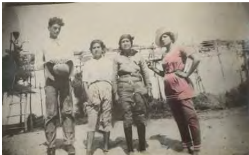
Grupos de choceros en épocas diferentes.