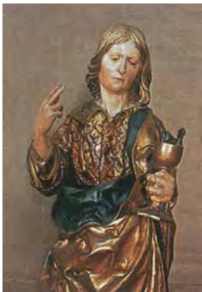
Fig. 18: San Juan evangelista del retablo mayor de la Catedral de Sevilla, Jorge Fernández y taller. Primer tercio del siglo XVI. Del libro "El retablo Mayor de la catedral de Sevilla".