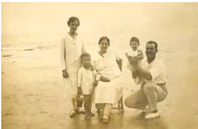
La familia al completo, posando el domingo en la orilla.