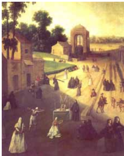
Vía-crucis a la Cruz del campo (Anónimo), siglo XVII.

Hay que decir que, cuando la hermandad de la Vera-Cruz de Pilas redactó sus nuevas Reglas en 1772 por extravío de las antiguas, en ningún momento alude a los disciplinantes para la salida que hacía la cofradía “el Jueves Santo en la tarde”, tan sólo que los hermanos “hayan de asistir vestidos de luz, como es costumbre” 29 . Quizá su redacción responda al espíritu ilustrado del siglo XVIII -poco propenso a los excesos piadosos- similar al que muestra el Arzobispo de Sevilla cuando en 1777 advierte “del abuso introducido en todo el reino de haber penitentes de sangre, o disciplinantes y empalados en las procesiones de Semana Santa, en las de la Cruz de Mayo y en algunas otras de rogativas; cuyas penitencias no las dicta por lo común el espíritu de compunción sino (...) la costumbre y mal entendida piedad” 30 . Aquel mismo año el rey