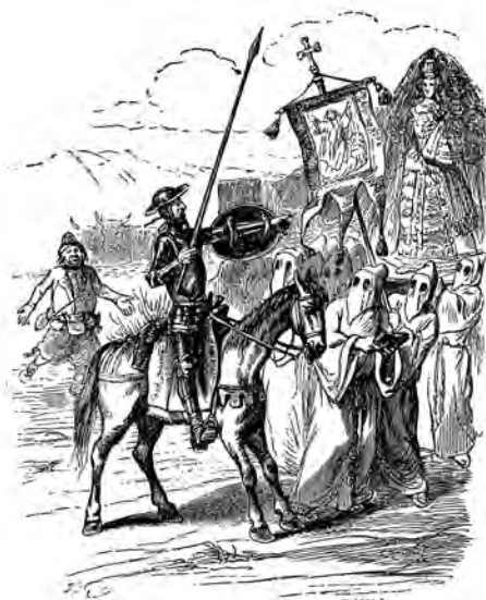
Escena de Don Quijote de la Mancha.

Según la Regla de la Vera-Cruz de Aznalcázar, la procesión se organizaba del siguiente modo: se abría con el mayordomo que portaba el estandarte, escoltado