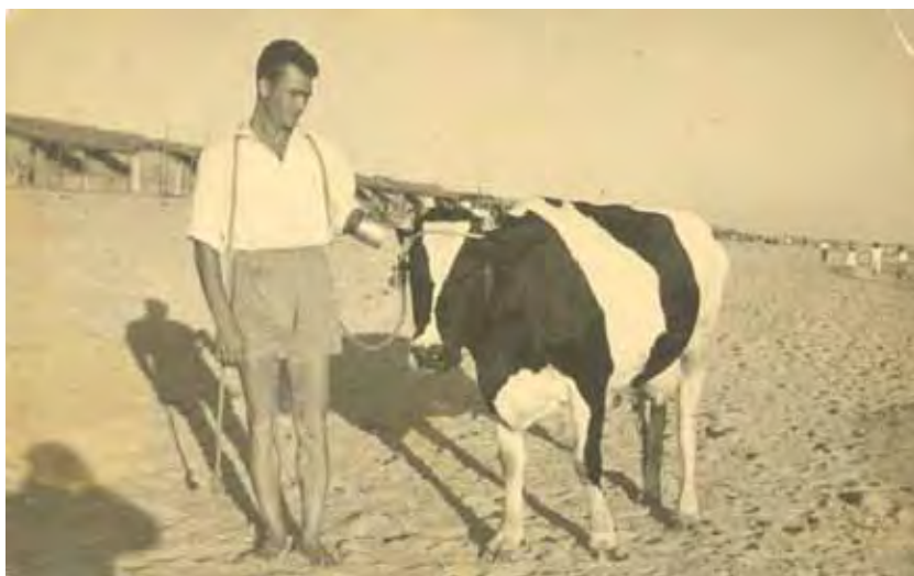
La leche se vendía recién ordeñada en la puerta de las chozas.