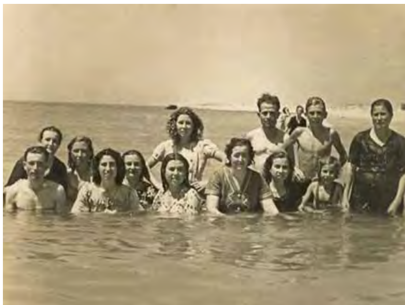
Diferentes grupos de bañistas.