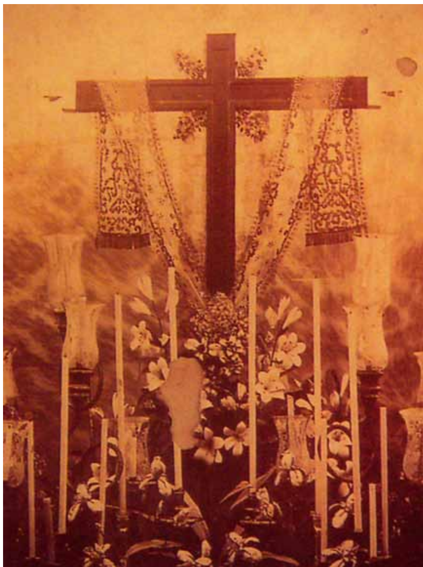
“Santa Cruz del humilladero como se venera en su capilla de Pilas”.