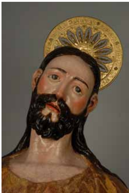
Fig. 10: Detalle de la cabeza, finalizado el proceso de reintegración cromática. Eugenio Fernández Ruiz. IAPH.

La cabeza del apóstol condensa unos rasgos muy marcados. La cabellera muy larga, peinada con la raya en el medio de color negro cae por toda la espalda. La frente despejada y amplia enmarcan las cejas oscuras dando paso a unos ojos grandes y expresivos de color negro dibujados a pincel. (Fig.10). La nariz es recta y afilada dando paso a una copiosa barba a tono con el cabello. La boca ligeramente entreabierta deja ver la hilera superior de los dientes.