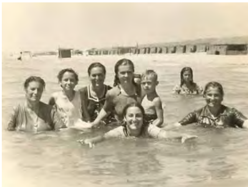
Grupo de bañistas en el agua, al fondo línea de chozas.