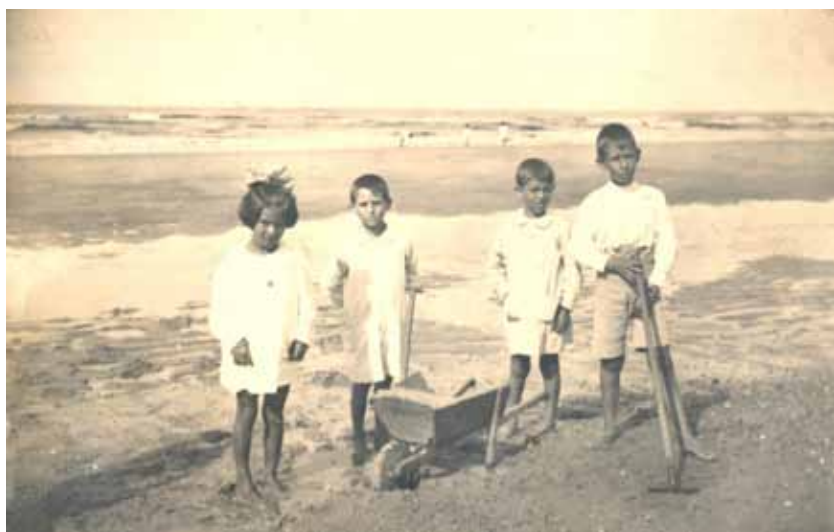
Niños en la orilla, años 20.