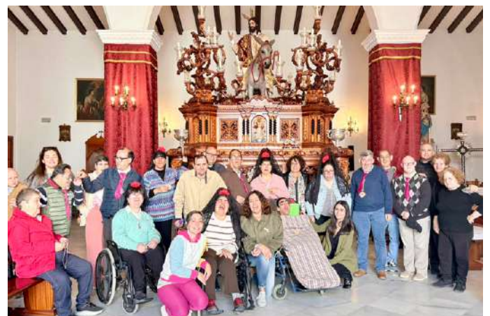
Ofrenda floral de la Escuela Infantil Municipal y del Centro Ocupacional Torre del Rey a La Borriquita.