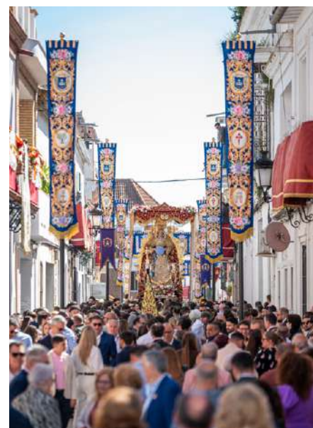
El Niño de Dios de las Carreritas y la Virgen de Belén.