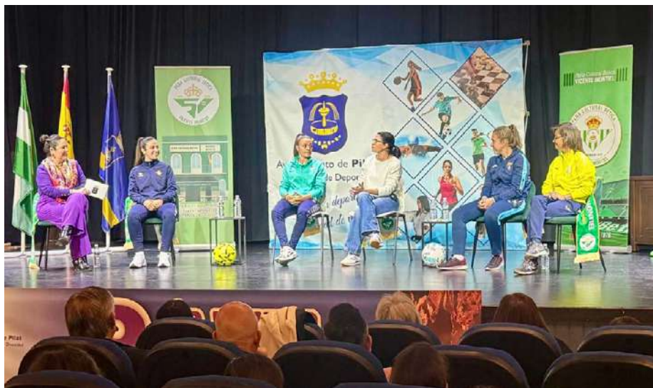
Charla-coloquio sobre fútbol femenino.

La programación se completó con la visita cultural “La Mujer en las Letras”, a cargo de Artépolis, así como diversos talleres dirigidos a mujeres, como el Taller Protagonistas y un curso de defensa personal femenina. Además, se desarrollaron actividades educativas en centros escolares, como los talleres “Firma y Confirma” y “Redes Sociales: Manosfera Referentes”.