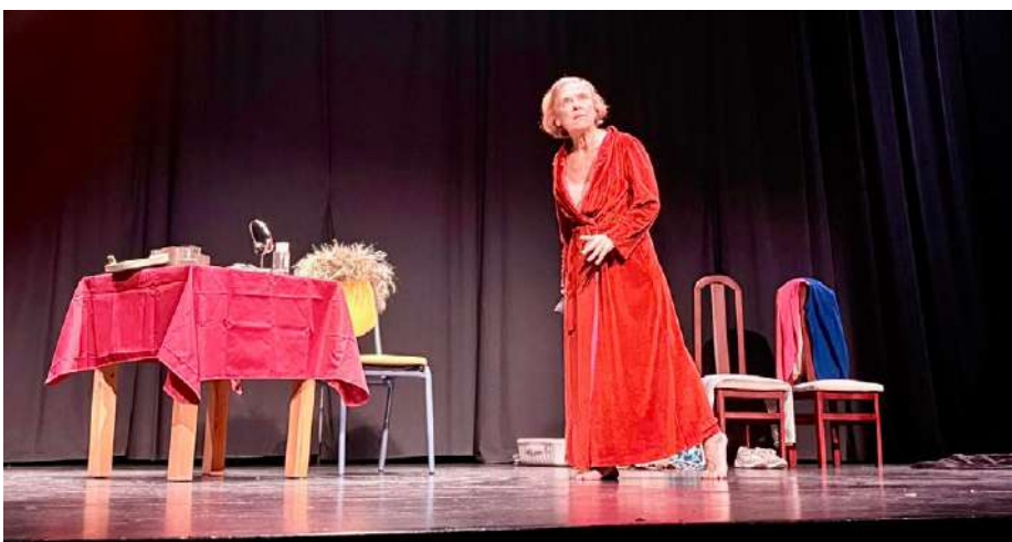
Representación de la obra 'Mi tercer acto'.