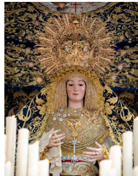
Santísimo Cristo de la VeraCruz y Nuestra Madre de Dios de Belén Coronada.