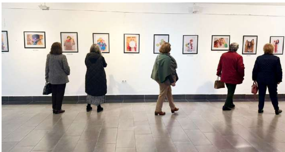
Exposición fotográfica 'Mujeres sin complejos'.