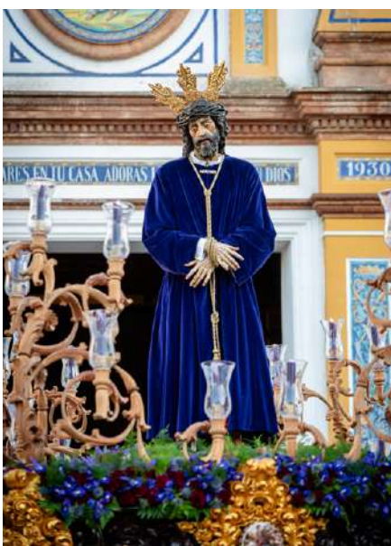
Nuestro Padre Jesús Cautivo y Virgen de los Dolores.

y se dirigió, por primera vez, hacia la Residencia de Ancianos Cristo Rey por la calle Obispo Jesús Domínguez, donde realizó el saludo por la fachada delantera, al igual que La Borriquita. La procesión continuó por Las Cuatro Esquinas y la Ermita Nuestra Se-