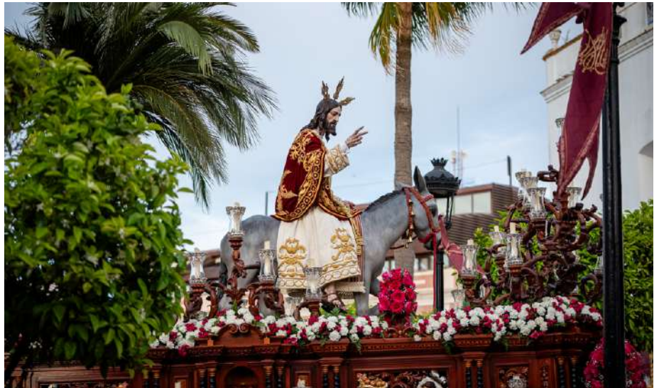
Salida procesional del Cristo del Amor.

El Domingo de Ramos dio el pistoletazo de salida a una nueva e ilusionante Semana Santa en la que la meteorología dio tregua. La primera gran fiesta de primavera arrancó por la mañana, con la Procesión de Palmas, que atravesó el municipio desde la Ermita hasta la Iglesia Parroquial. Por la tarde, el Santísimo Cristo del Amor, a lomos de La Borriquita, recorrió las calles en un año especialmente señalado, pues se conmemoró el 25 aniversario de la bendición de la imagen. La procesión salió desde la Capilla del Corazón de Jesús, y pasó por la residencia de ancianos Cristo Rey, la Iglesia Parroquial Santa María la