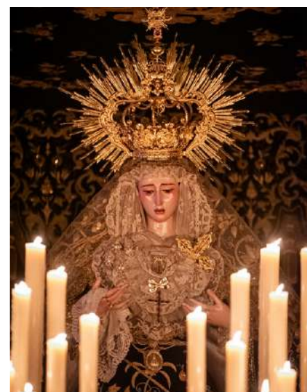
Santísimo Cristo del Descendimiento y María Santísima en su Soledad.