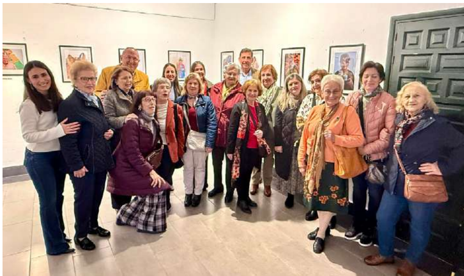
Acto institucional en la Casa de la Cultura.