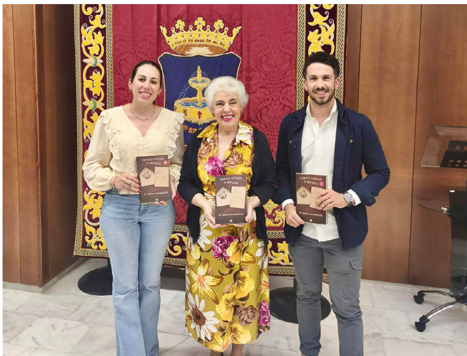
Presentación del libro.

Como parte de la programación, el pasado 23 de abril tuvo lugar también la entrega de premios del concurso de carteles del Día Internacional del Libro, una iniciativa impulsada conjuntamente por el