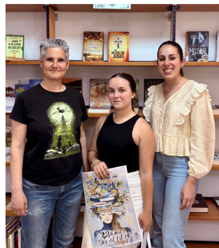
Entrega del premios del concurso de carteles.

Ayuntamiento de Pilas y la Biblioteca Pública Municipal con el objetivo de fomentar la creatividad y promover la participación ciudadana en torno a esta celebración cultural.